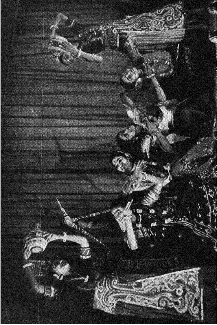
अमर भारत का एक दृश्य ।